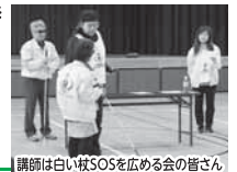
講師は白い杖SOSを広める会の皆さん

障がいのある方から学び、誰もが安心できるくらしを考えます。 開催日/令和4年8月20日(土) 10時～12時 参加費/無料