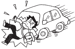
ボランティア活動に向かう途中、交通事故にあつて亡くなられた。