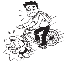
自転車でボランティア活動に向かう途中、誤って他人にケガをさせた。