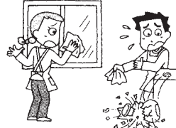
家事援助ボランティア活動で清掃中、誤って花瓶を落としてこわした。

ボランティアがボランティア活動中の偶然な事故により他人にケガを負わせたり、他人の物をこわした事等により法律上の損害賠償責任を負われた場合に保険金をお支払いします。