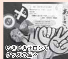
いきいきサロンのグッズの品々