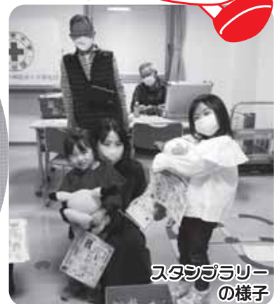
スタンプラリーの様子