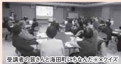
受講者の皆さんと海田町にちなんだクイズ