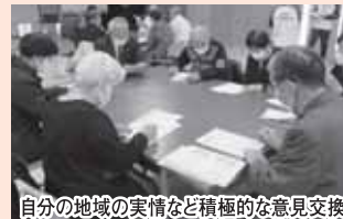
自分の地域の実情など積極的な意見交換