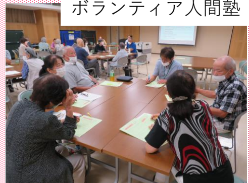
ボランティア人間塾