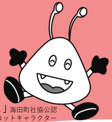
「ほっく」海田町社協公認 マスコットキャラクター